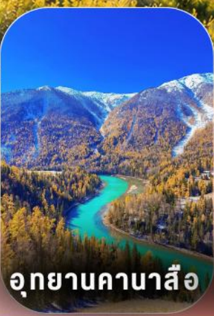
อุทยานคานาสีอ

ชำระเป็นค่าทัวร์ในชื่อ "บริษัท กัสโต เวิลด์ ทัวร์ จำกัด" เท่านั้น