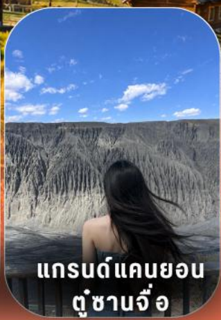
แกรนด์แคนยอน ตุ่ซานจื่อ