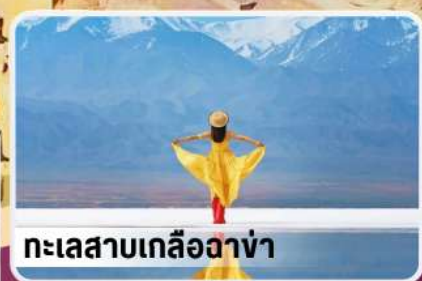
ทะเลสาบเกลืออาง่า