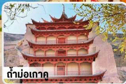
ตำบ่อเกา