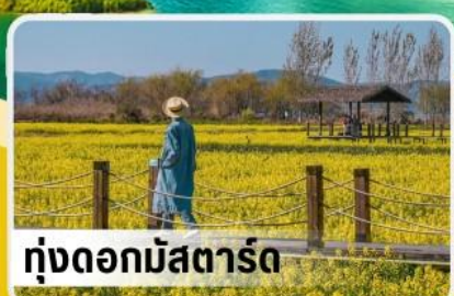
ทุ่งดอกมัสตาร์ด