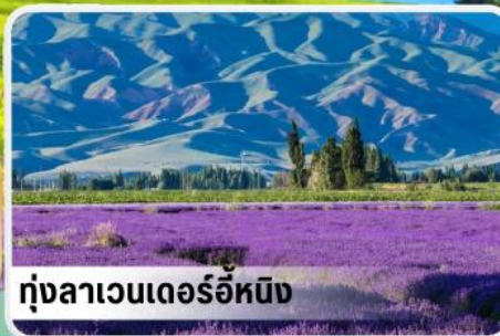
ทุ่งลาเวนเดอร์อิ๋หนิง