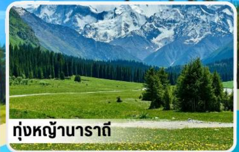
ทุ่งหญ้านาราตี