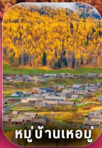
หมู่บ้านเหม่มู

中國東方航空公司 China Eastern Airlines 9 วัน 7 คืน