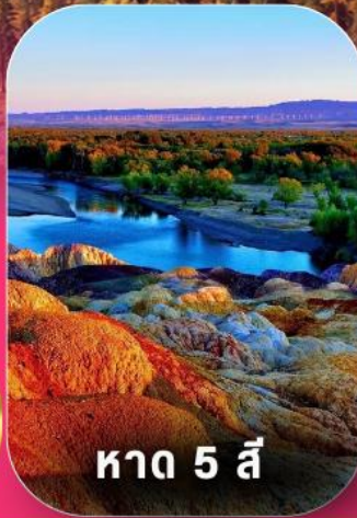
หาด 5 สี