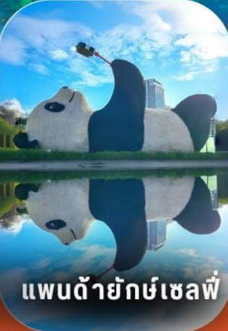
แพนด้ายักษ์เซลฟ์