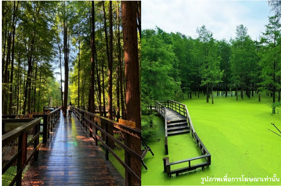
รูปภาพเพื่อการโฆษณาเท่านั้น