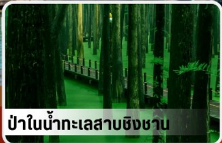
ป่าในน้ำทะเลสาบชิงชาน