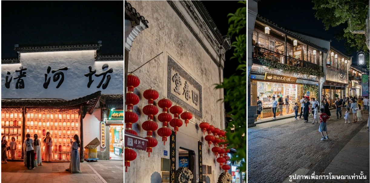
รูปภาพเพื่อการโฆษณาเท่านั้น

จากนั้นนำท่านเดินทางสู่ ห้างสรรพสินค้าอินไทอิน77 แหล่งช้อปปิ้งขนาดใหญ่ใจกลางเมืองหางโจว ที่ตั้งอยู่ใกล้ย่านซีหู โดดเด่นด้วยบรรยากาศทันสมัย ผสมผสานระหว่างห้างสรรพสินค้าและไลฟ์สไตล์คอมเพล็กซ์ ภายในรวบรวมแบรนด์ชั้นนำทั้งสินค้าแฟชั่น ร้านอาหาร คาเฟ่ และสินค้าไลฟ์สไตล์ไว้อย่างครบครัน เหมาะสำหรับการช้อปปิ้ง พักผ่อน และสัมผัสบรรยากาศเมืองใหญ่ของจีนอย่างแท้จริง