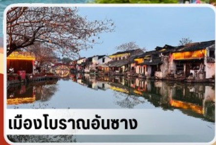
เมืองโบราณอันชาง