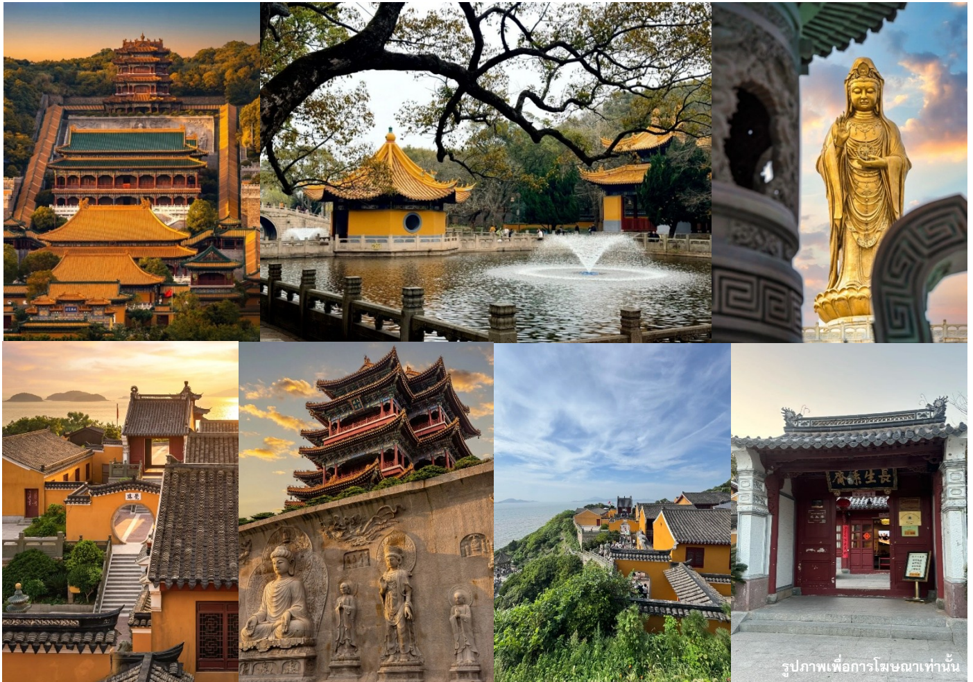
รูปภาพเพื่อการโฆษณาเท่านั้น

จากนั้นนำท่านสักการะ วัดผุจี้ ซึ่งถือเป็นวัดที่ใหญ่และสำคัญที่สุดบนเกาะผุ่ถ่อ ซาน มีประวัติยาวนานและเป็นศูนย์กลางของการบูชาพระโพธิสัตว์กวนอิม ภายในวัดมีสถาปัตยกรรมที่งดงามโดดเด่นด้วยวิหารหลักและลานกว้างสำหรับประกอบพิธีกรรมทางศาสนา บรรยากาศเงียบสงบเหมาะแก่การสักการะ ขอพร และเสริมสิริมงคลให้กับชีวิต โดยเชื่อกันว่าผู้ที่มากราบไหว้ด้วยจิตศรัทธาจะได้รับความเป็นสิริมงคล ความเจริญรุ่งเรือง และความสมหวังในสิ่งที่ปรารถนา นำท่านนมัสการองค์พระโพธิสัตว์เจ้าแม่กวนอิม “ไม่ยอมไป” ณ วัดไผ่ม่วง อีกหนึ่งวัดสำคัญที่ตั้งอยู่บนเกาะผุ่ถ่อซาน ซึ่งได้รับสมญานามว่า “เกาะพระโพธิสัตว์” ด้วยความศักดิ์สิทธิ์และเป็นศูนย์รวมศรัทธาของพุทธศาสนิกชน ภายในวัดเป็นศาลเจ้าเล็ก ๆ ตั้งอยู่ติดริมทะเล โอบล้อมด้วยธรรมชาติอันเงียบสงบ ไฮไลท์ของวัดคือ “ เจ้าแม่กวนอิมไม่ยอมไป ” มีตำนานตั้งแต่สมัยราชวงศ์ถัง เล่าว่าพระภิกษุชาวญี่ปุ่นอัญเชิญองค์เจ้าแม่กวนอิมกลับประเทศ แต่เกิดพายุจน