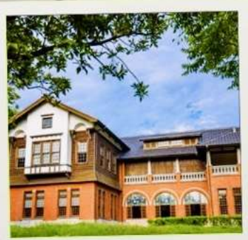
พิพิธภัณฑ์น้ำพุร้อนเป่ย์โถว