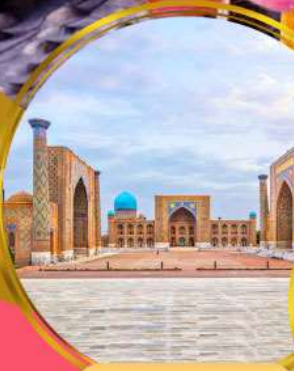
จัตุรัสเรฮิสถาน