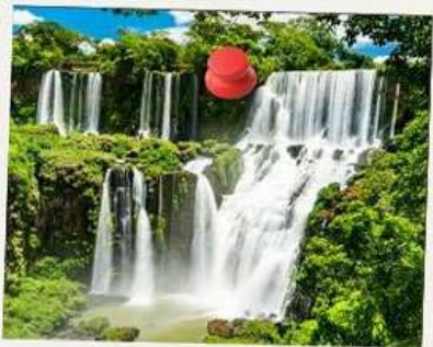
IGUAZU FALLS ✨