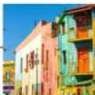
DAY 16-18 IN FLIGHT TO BANGKOK