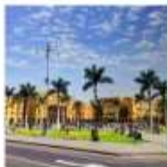
DAY 10 CUSCO - LIMA