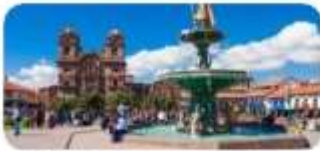
Plaza de Armas de Cusco

07.00 รับประทานอาหารเช้า 08.00 เที่ยวเมืองกุสโก