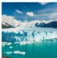
DAY 13 - 15 PATAGONIA