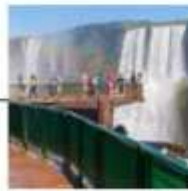
DAY 4 - 6 IGUAZU FALLS