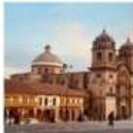
DAY 6 - 7 LIMA - CUSCO