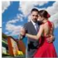
DAY 11-12 BUENOS AIRES