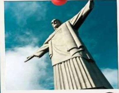
RIO DE JANAÍRO 😊