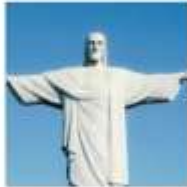
DAY 2 - 4 RIO DE JANAIRO