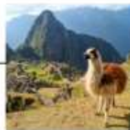
DAY 7 - 9 CUSCO MACHU PICCHU