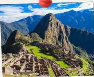
MACHU PICCHU 🏛️