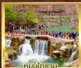
หยุนโกซาน