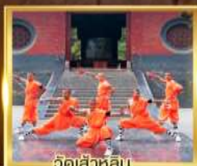
วัดเล่าหลิน