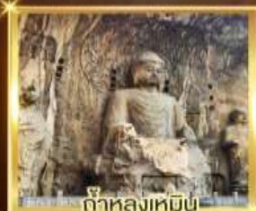
ถ้ำหลงเหมิน