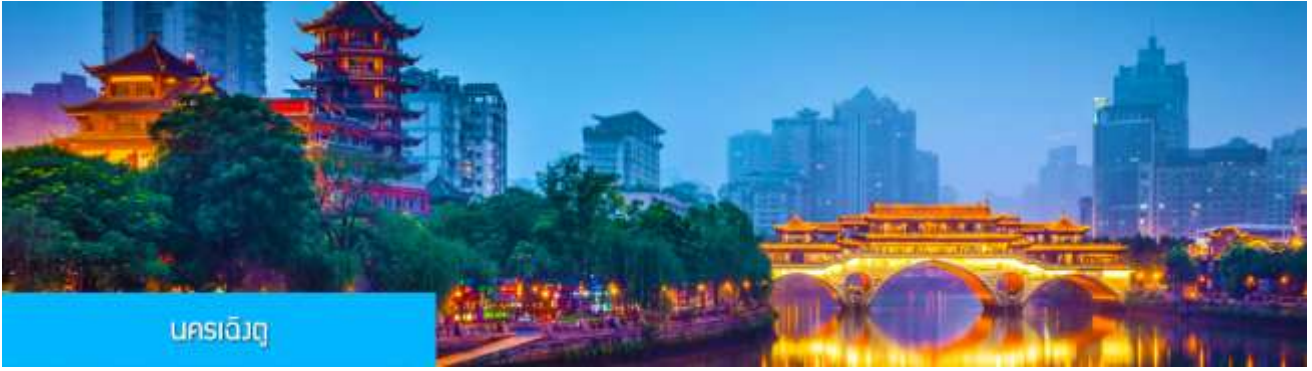
นครเฉิงตู