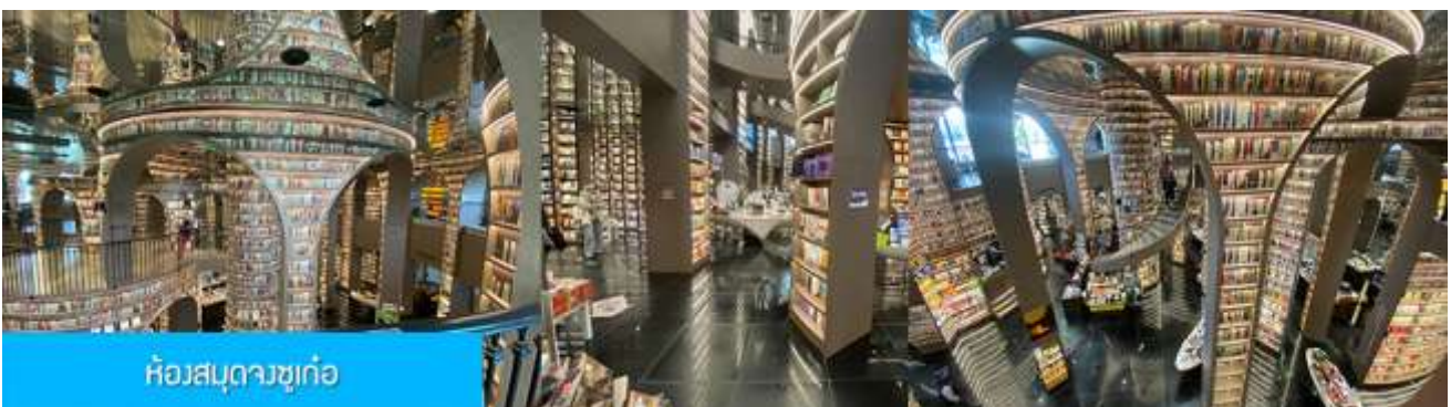
ห้องสมุดจงชู่เก๋อ