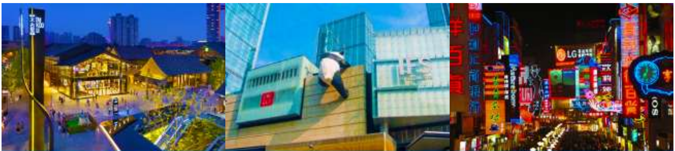
ถนนไท่กุ่หลี่ และวัดต้าฉือ