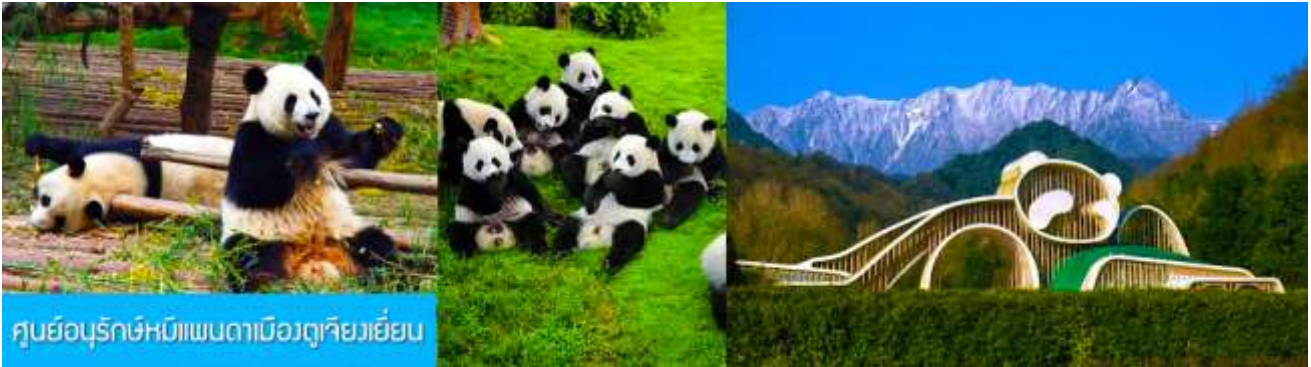
ศูนย์อนุรักษ์หมีแพนด้าเมืองตูเจียงเยียน

เช้า รับประทานอาหารเช้า ณ ห้องอาหารของโรงแรม (7) หลังอาหารเช้าท่านสามารถเลือกที่จะซื้อ โปรแกรมทัวร์เสริม หรืออิสระพักผ่อนตามอัธยาศัยใน โรงแรม