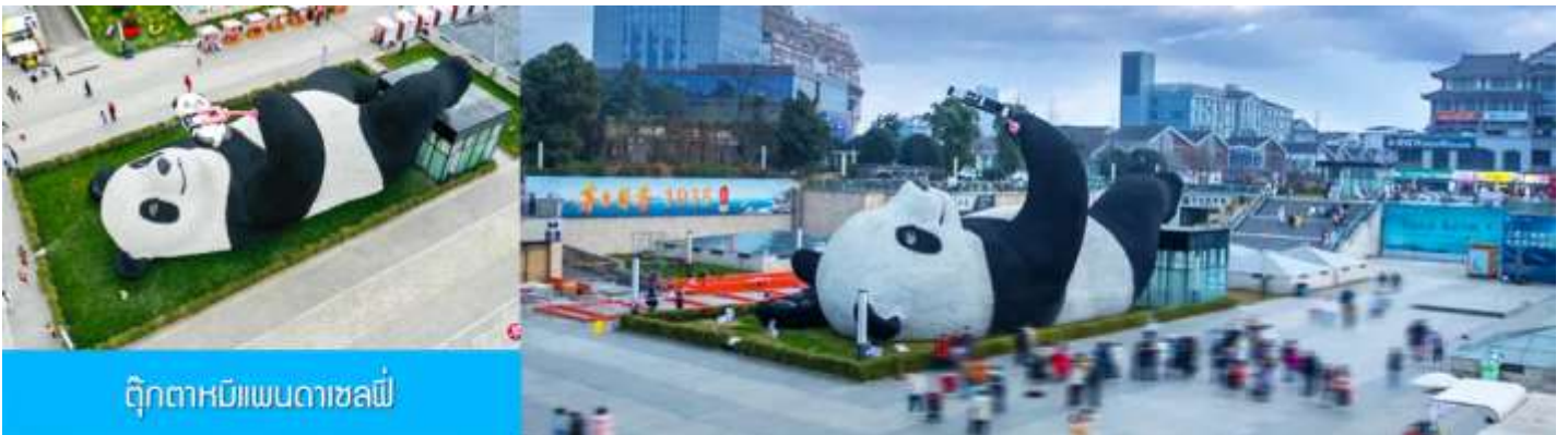
ตุ๊กตาหมีแพนด้าเซลฟี

เที่ยง รับประทานอาหารกลางวัน ณ ร้านอาหารพื้นเมือง (8)