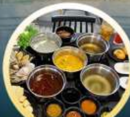
ชาบูฮ่องกง

02-04 มิ.ย. 18-20 มิ.ย. 07-09 มิ.ย. 20-22 มิ.ย. 13-15 มิ.ย. 25-27 มิ.ย. 14-16 มิ.ย. 28-30 มิ.ย.