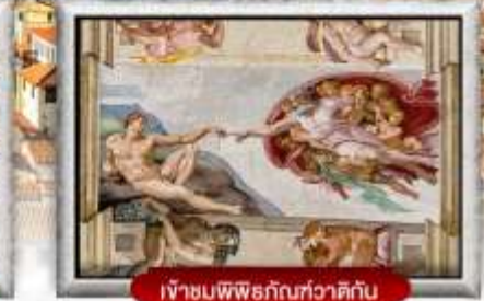
เข้าชมพิพิธภัณฑ์ทิวาติกัน

เมนูพิเศษ! สปาเกตตีเส้นหมึกดำ, พิชซ่าสไตล์อิตาลีเย็นแท้