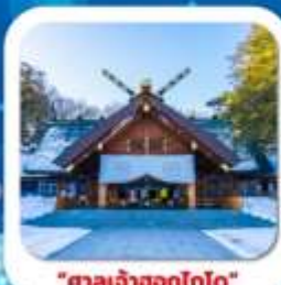
"ศาลเจ้าออกโทโก"