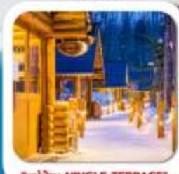
"หมู่บ้าน NINGLE TERRACE"

สนุกสนาน ณ ลานหิมะ • หมู่บ้านรามเมอาซาฮิคาว่า • หมู่บ้านนิงเกิลเทอร์เรส ชมวนพาเหรดเพนกวิน ณ สวนสัตว์อาซาฮิคาว่า • พิพิธภัณฑ์กล่องดนตรี โอตารุ • ศาลเจ้าออกโทโก • พระใหญ่ HILL OF BUDDHA • บุฟเฟ่ต์นันทะ