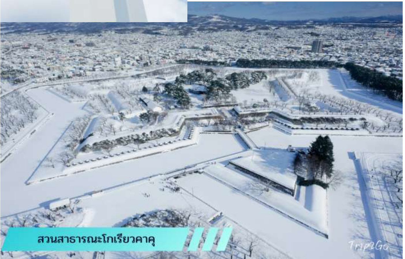
สวนสาธารณะโกเรียวกาคู

จากนั้น เดินทางเข้าสู่ ป้อมปราการโกเรียวกาคู (GORYOKAKU) ตั้งอยู่ใจกลางเมืองฮาโกดาเตะ เมื่อมองจากการออกแบบห้าด้านแล้ว จะเห็นได้ชัดว่าเป็นป้อมปราการทรงดวงดาว เพราะป้อมปราการแห่งนี้ได้รับการออกแบบโดยทาเคดะ อะยะฮะฮะบุโระ และได้รับอิทธิพลทางการออกแบบจากเวบบัน วิศวกรทางทหารชาวฝรั่งเศส ป้อมแห่งนี้เป็นป้อมปราการแห่งแรกในรูปแบบตะวันตกในประเทศญี่ปุ่น ป้อมแห่งนี้ได้สร้างเสร็จในปี ค.ศ.1864 ( ราคาทัวร์ไม่รวมค่าลิฟต์ขึ้นชมหอคอย คนละประมาณ 800 เยน )