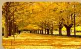
สวนโซะวะคิเอน