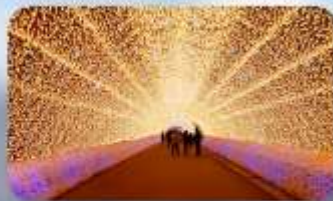
เทศกาลประดับไฟ นาบานาโนะซาโตะ