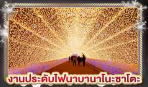
งานประดับไฟนาบานาโนะซาโตะ