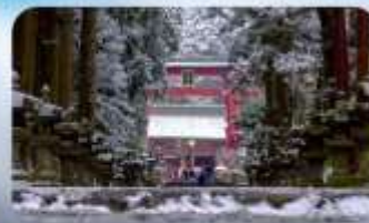
ศาลเจ้าคิตะกุจิฮอนกุ ฟุจิ เซ็นเกิน