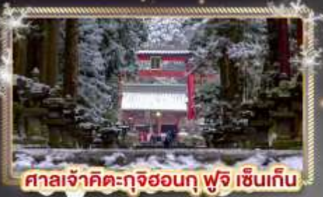
ศาลเจ้าคิตะกุจิฮอนกุ ฟุจิ เซ็นเกิน

🍲 พิเศษ!! ที่พักรับประทานอาหาร Onsen 1 คืน