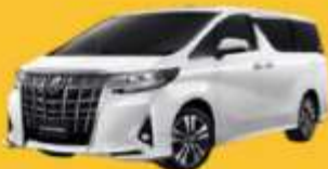
Alphard (2-4 ท่าน)