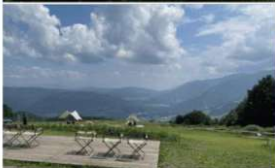
รูปภาพใช้เพื่อประกอบการโฆษณาเท่านั้น