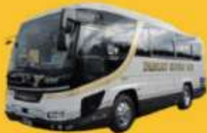
Bus (10-20 ท่าน)

➔ สำหรับท่านที่ต้องการความเป็นส่วนตัวมากขึ้น ท่านสามารถเลือกใช้บริการ รถส่วนตัวได้โดยมีรูปแบบรถให้เลือกถึง 3 ประเภท โดยรถ แต่ละประเภทสามารถนั่งได้ตั้งแต่ 2 ท่านขึ้นไป