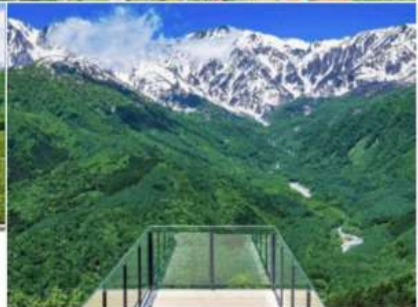
HAKUBA MOUNTAIN HARBOR THE CITY BAKERY