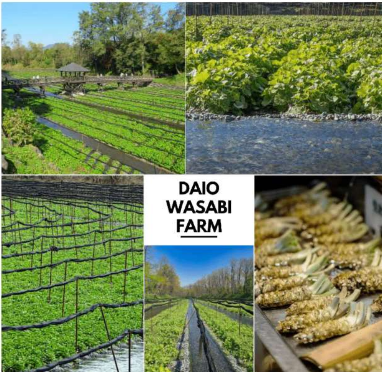
รูปภาพใช้เพื่อประกอบการโฆษณาเท่านั้น

เพื่อนำท่านสู่ ไดโอะวาซาบิฟาร์ม (Daio Wasabi Farm) เป็นไร่วาซาบิที่มีขนาดใหญ่ที่สุดในประเทศญี่ปุ่น ที่มีจึงกินพื้นที่ทั้งหมด 150,000 ตารางเมตร ซึ่งกรรมวิธีในการผลิตวาซาบินั้น ค่อนข้างที่จะซับซ้อน และพิถีพิถันมากเลยทีเดียว เริ่มจากสถานที่ในการปลูกต้นวาซาบิต้องปลูกในที่มีน้ำใสสะอาดไหลผ่านเท่านั้น ที่มีจึงเหมาะสมมาก เพราะมีน้ำที่ไหลมาจากเทือกเขาแอลป์แปป (North Japan Alps) ไหลผ่านตลอด เกมเต็มเปี่ยมไปด้วยแร่ธาตุสำคัญ ถือเป็นปัจจัยหลักที่ทำให้วาซาบิของที่นี่คุณภาพดี นอกเหนือจากการเยี่ยมชมฟาร์มวาซาบิแล้ว วิถีทัศน์ของที่นี่ยังไม่เป็นรองใคร เพราะล้อมรอบไปด้วยเทือกเขาแอลป์แปป ท่านจะได้เห็นธรรมชาติแบบ 360 องศา สามารถมาเที่ยวได้ทุกฤดู ใช้เวลาเดินทางประมาณ 1 ชั่วโมง