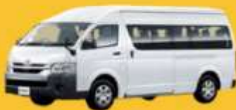
VAN (2-8 ท่าน)