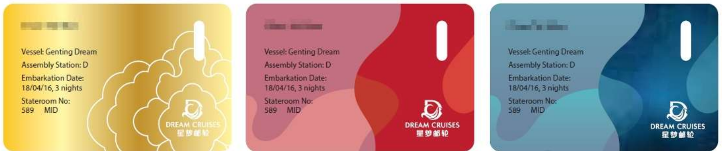
**รูปภาพด้านบนใช้เพื่ออ้างอิงรูปแบบการ์ดเท่านั้น** หากกรณีการ์ดสูญหายกรุณาติดต่อแจ้งทาง Reception