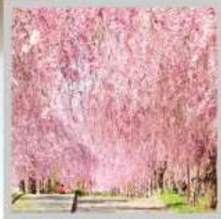
"NICCHUSEN WEEPING SAKURA"