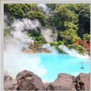
"BEPPU UMI JIGOKU"