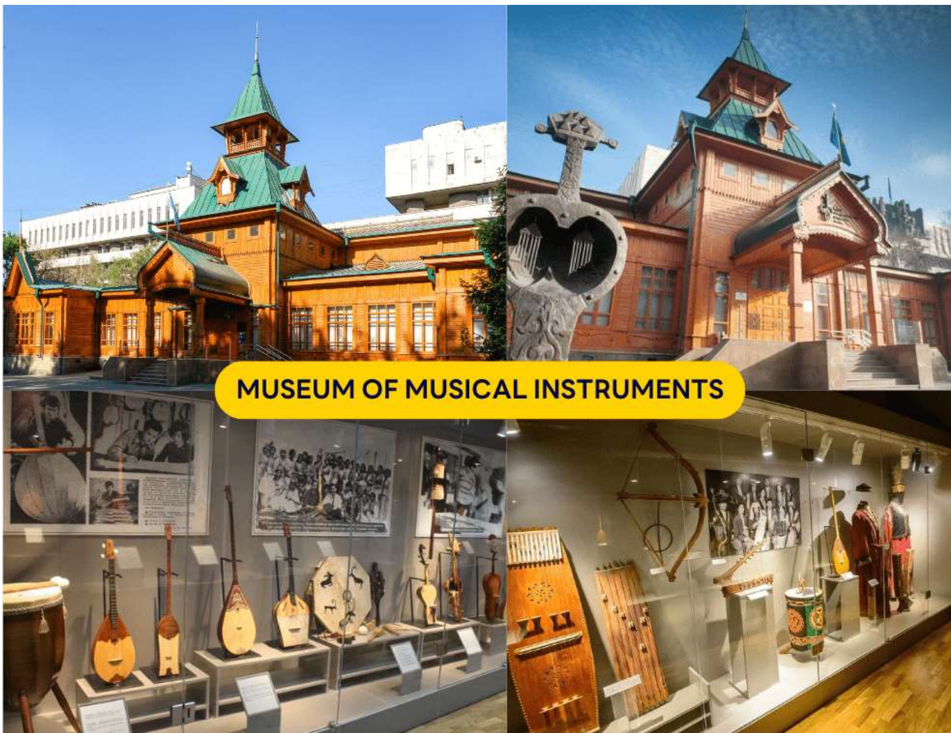
MUSEUM OF MUSICAL INSTRUMENTS

จากนั้นนำท่านเข้าชม พิพิธภัณฑ์เครื่องดนตรี(Museum of Musical Instruments) อาคารไม้ฝีมือสถาปนิก A.P. Zenkov สร้างในปี 1908 ได้รับชื่อ “พิพิธภัณฑ์ Ykylas” เพื่อเป็นเกียรติแก่นักประพันธ์เพลงพื้นบ้านชาวคาซัคที่สำคัญ โดยที่นี่จะประกอบด้วยเครื่องดนตรีแบบดั้งเดิม กว่า 1,000 ชิ้น เครื่องดนตรีคาซัคกว่า 60 ประเภท เช่น ดอมบรา (dombra), โคบีซ (kobyz), ซิลดิร์มัก (syldyrmak) และเครื่องดนตรีจากชนชาติในกลุ่มภาษาตุรกี และต่างประเทศกว่า 27 ประเทศ