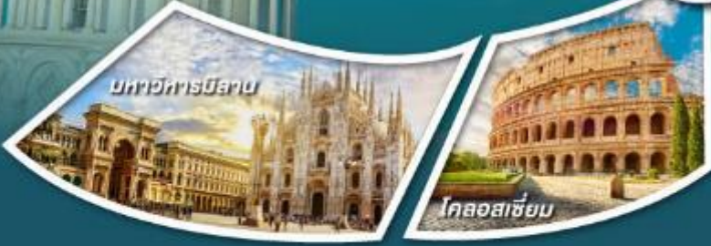
มหาวิหารมิลาน