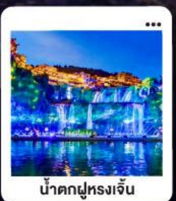
น้ำตกฉูหลงจิ้น

"มหัศจรรย์...จางเจียเจี๋ย" | ดินแดนแห่งขุนเขาและสายน้ำ "เขาเกียนเหมินซาน" | ประสูติสวรรค์...ทำกายศรึกษา 999 ชั้น | นั่งรถไฟความเร็วสูง สัมผัสความสวยงามตระการตา "อุทยานเขาวัง" | ล่องลอยกลางขุนเขา...ดั่งภาพฝันในห้วงเจียเจี๋ย | ช้อปปิ้ง POPMART "เมืองโบราณ" ฉูหลง | หยุคเวลา ณ เมืองโบราณน้ำตก... | "เฟิ่งหวง" ล่องเรือชมชีวิตริมแม่น้ำกิวเจียง "นครฉางซา" ปิดท้ายความทันสมัย