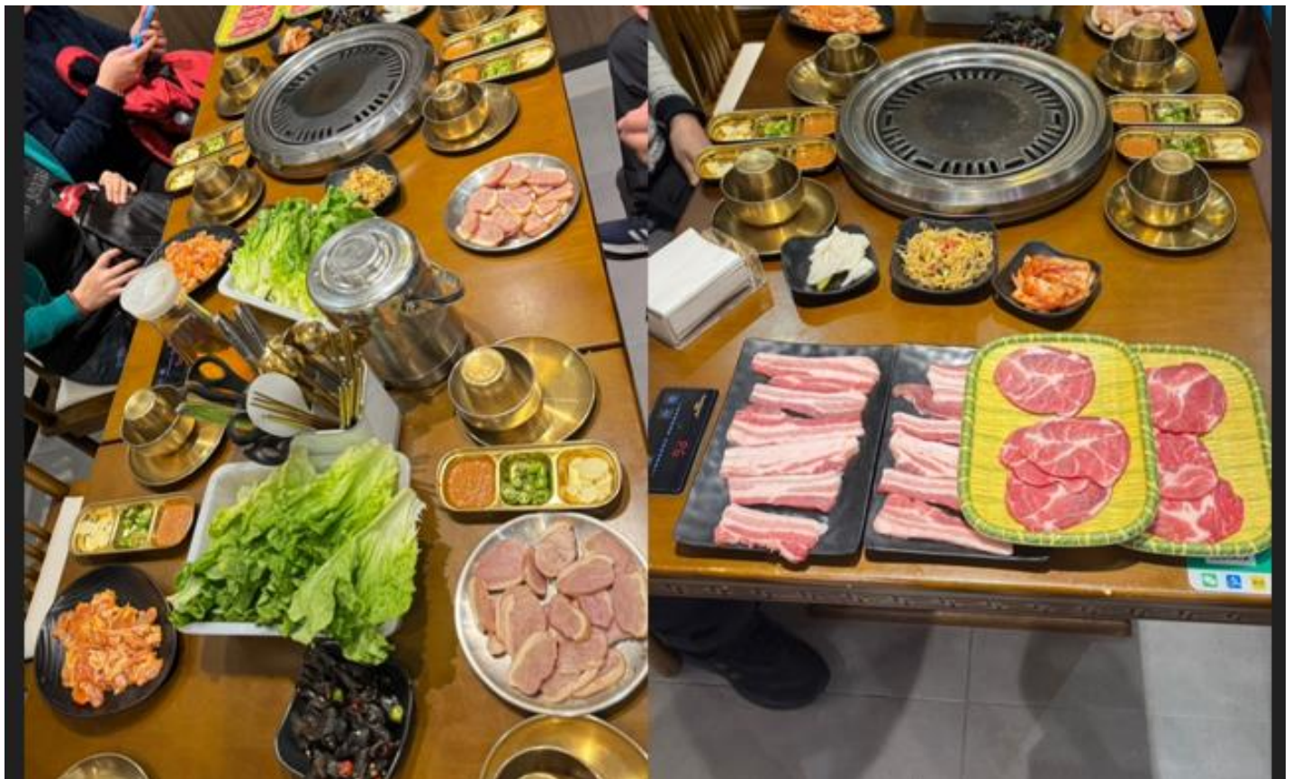
สมควรแก่เวลานำท่านเดินทางเข้าสู่ที่พัก

เติมเต็มพลังงานและความสุขได้เท่ากับมื้ออาหารที่เต็มไปด้วยชีวิตชีวา บาร์บีคิวของจีน หรือที่รู้จักกันในชื่อ "เซาเซา" มีประวัติศาสตร์ยาวนาน และเป็นส่วนสำคัญของวัฒนธรรมอาหารริมทางและมื้อค่ำสุดพิเศษสำหรับที่จางเจียเจีย ซึ่งอยู่ในมณฑลหูหนาน อาหารจะมีรสชาติเผ็ดร้อนและหอมเครื่องเทศเป็นเอกลักษณ์