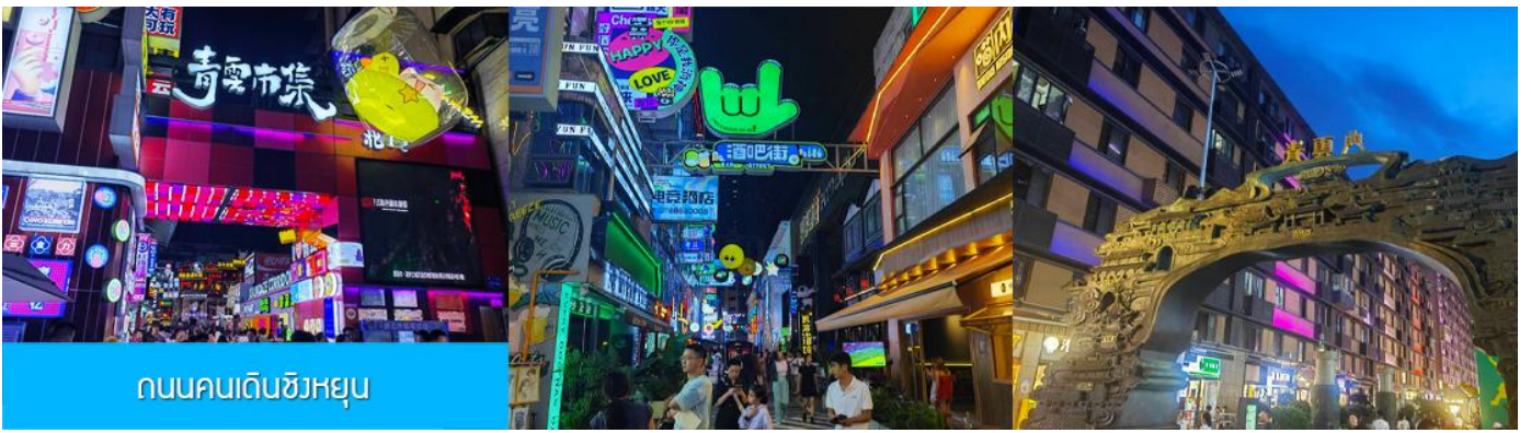
ถนนคนเดินชิงหยุน

เย็น บริการอาหารเย็น ณ ภัตตาคาร(มื่อที่ 9) หลังอาหารนำท่านเที่ยว ถนนคนเดินชิงหยุน 青云市集 เป็นย่านการค้าโบราณที่ถูกพัฒนาเป็นแหล่งรวมร้านค้าและสตรีทฟู้ดที่คึกคักใจกลางเมืองกุ้ยหยาง ให้ท่านเพลิดเพลินกับการเดินชมหรือเลือกซื้อสินค้าพื้นเมืองในย่านการค้าที่คึกคักแห่งนี้ พักที่ HOLIDAY INN HOTEL ระดับ 4 ดาวท้องถิ่นหรือเทียบเท่าในเมืองกุ้ยหยาง