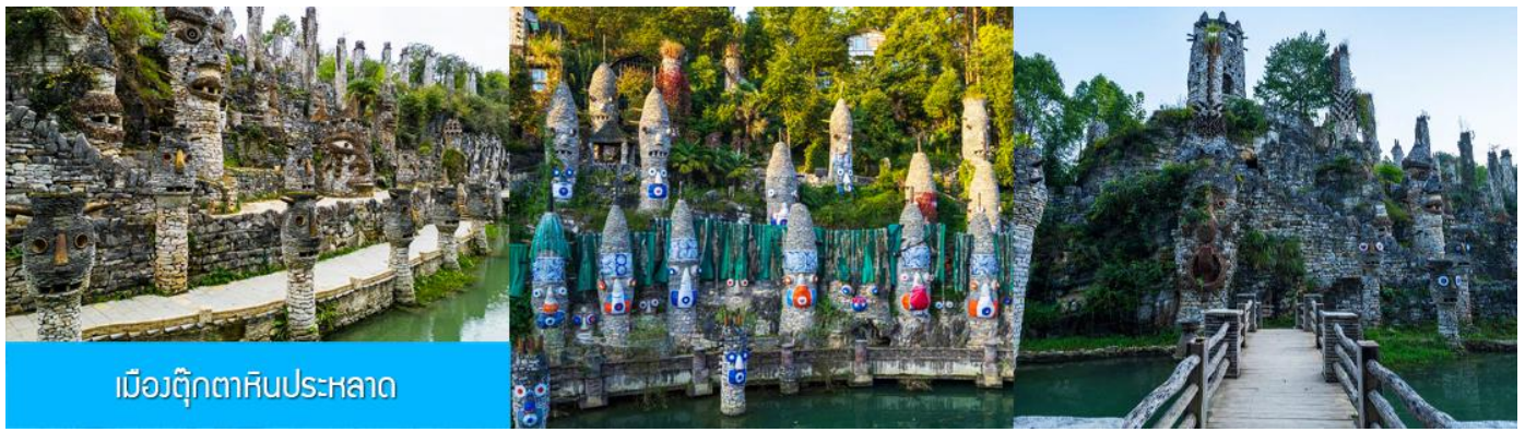
เมืองตุ๊กตาหินประหลาด