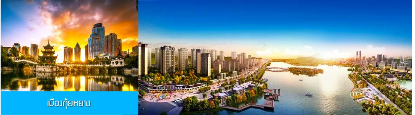
เมืองกู่หยาง