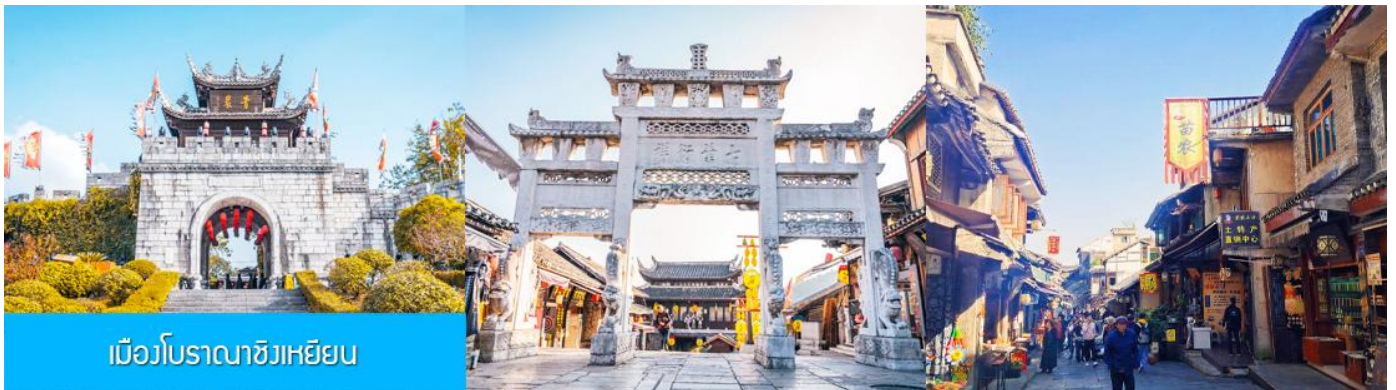
เมืองโบราณชิงเหยียน

เที่ยง รับประทานอาหารกลางวัน ณ ภัตตาคาร (มื้อที่ 8)