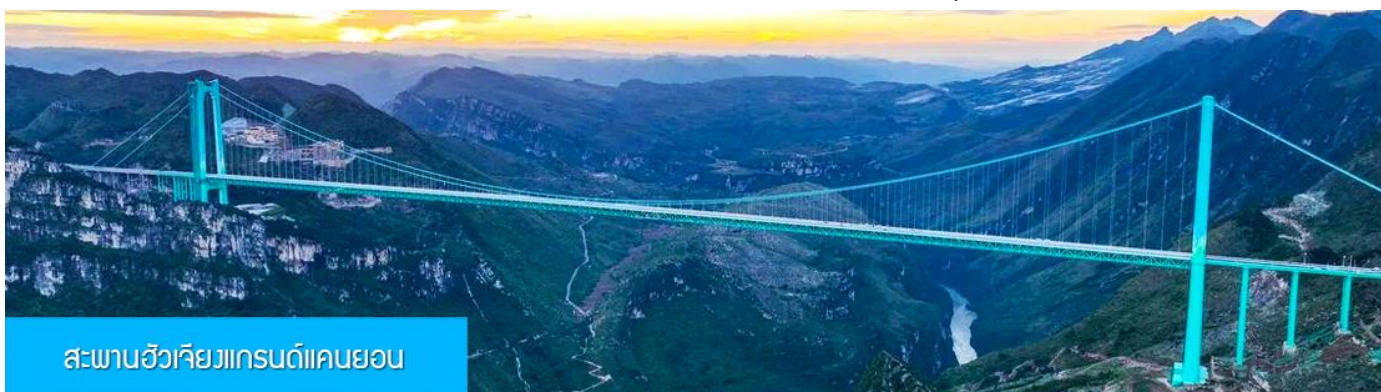
สะพานฮัวเจียงแกรนด์แคนยอน

พักที่ WINDHAM HOTEL โรงแรมระดับ 4 ดาวท้องถิ่นในเมืองอันชุ่น