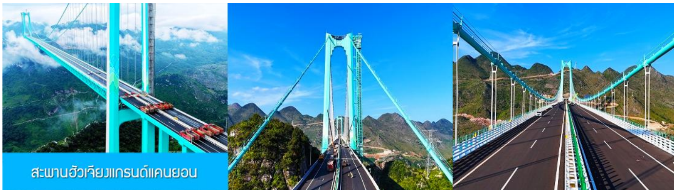
สะพานฮิวเจียวเกรนด์แคนยอน

ไกด์นำเสนอ OPTIONAL TOUR แพคเกจเที่ยวชมตัวสะพาน รวมค่าบัตรนั่งลิฟท์แก้วขึ้นสู่ชั้นชมวิวบนทาวเวอร์ รวมค่ารถรับส่งจากศูนย์บริการนักท่องเที่ยวสู่ตัวสะพาน รวมกาแฟบนหอคอยชมวิวท่านละ 1 แก้ว อัตราค่าบริการ 380 หยวนหรือ 1,900 บาทต่อท่าน