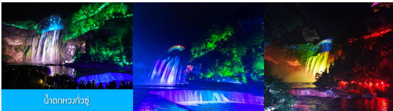
น้ำตกหวงกั๋วชู่

หลังอาหารนำท่านเที่ยวชม น้ำตกหวงกั๋วชู่ 黄果树瀑布 แหล่งท่องเที่ยวขึ้นชื่อระดับ 5A ที่ถือเป็นสัญลักษณ์ของมณฑลกุ้ยโจว เป็นหมู่ น้ำตกที่ประกอบด้วยน้ำตกน้อยใหญ่กว่าสิบแห่ง โดยมีน้ำตกหวงกั๋วชู่เป็นน้ำตกขนาดใหญ่ที่มีความสูง 74 เมตร กว้าง 81 เมตร เป็นน้ำตกหลักของอุทยาน ชมความสวยงามของน้ำตกที่ประดับด้วยแสงสีและเลเซอร์ยามค่ำคืน ที่แต่งแต้มความมหัศจรรย์แก่อุทยานแห่งนี้ (ค่าทัวร์รวมค่ารถรับส่ง รวมค่าบันไดเลื่อนขาลง และขาขึ้นภายในอุทยาน)