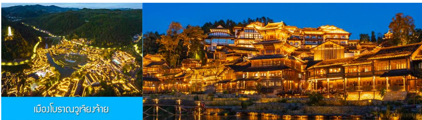
เมืองโบราณวูเจียงจ้าย

หลังอาหารนำท่านเที่ยวชม เมืองโบราณวูเจียงจ้าย 乌江寨景区 เป็นอุทยานท่องเที่ยวริมเมืองโบราณชนเผ่าเหมียว (ชนเผ่าม้ง) ที่ได้ชื่อว่ามีวิวกลางคืนที่สวยงามที่สุดของมณฑลกุ้ยโจว อุทยานนี้รวมไว้ซึ่งแหล่งท่องเที่ยว สถานที่ถ่ายทำภาพยนตร์ ร้านอาหาร รีสอร์ท ศูนย์ประชุม ด้วยทุนสร้างกว่าหมื่นล้านหยวน สัมผัสบ้านเรือนโบราณของชนเผ่าเหมียว ซึ่งเป็นชนกลุ่มหลักที่พำนักในพื้นที่มานาน ปัจจุบันชนเผ่าเหมียวยังคงรักษาไว้ซึ่งขนบธรรมเนียมและวิถีชีวิตแบบดั้งเดิม ชมการแสดงพื้นเมือง และการละเล่นพื้นเมืองของชนกลุ่มน้อยต่างๆ ในช่วงหัวค่ำบ้านทุกหลังในอุทยานจะประดับด้วยแสงไฟที่งดงาม และมีการแสดงต่าง ๆ อาทิ การบิน โดรน น้ำพุ และการยิงแสงเลเซอร์ ฯลฯ (ค่าทัวร์รวมค่ารถรับส่งภายในเขตอุทยาน ค่าทัวร์ไม่รวมค่านั่งเรือแจวในเขตอุทยาน)