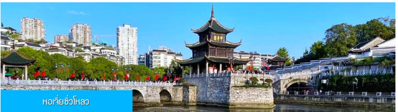
หอเจี้ยวโหลว