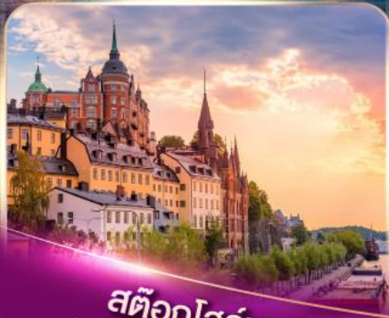
สต็อกโฮล์ม เวนิสแห่งยุโรปเหนือ