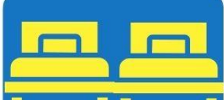
ห้องพักเตียงคู่ TWIN