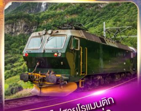
รถไฟสายโรแมนติก ฟลัมส์บาน่า