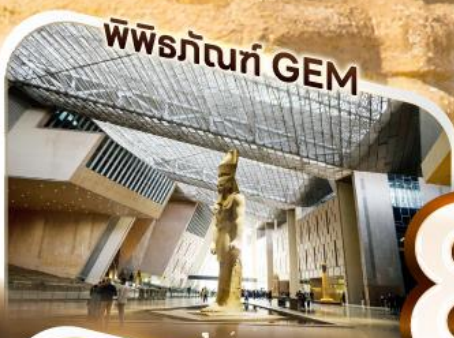
พิพิธภัณฑ์ GEM