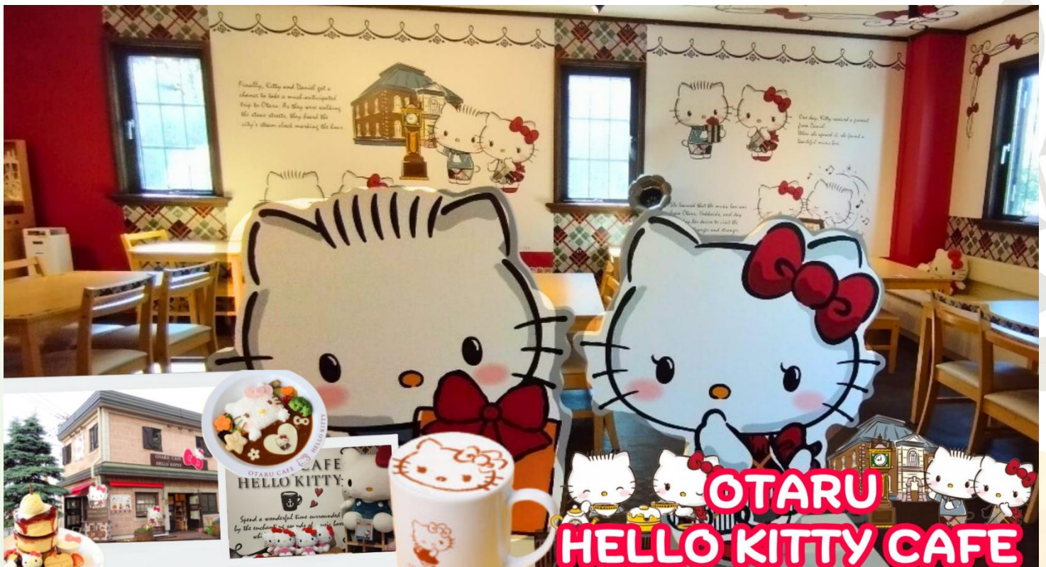
กลางวัน รับประทานอาหารกลางวัน ณ ร้านอาหาร (มื้อที่ 6)