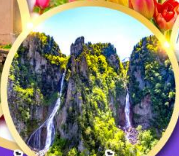
น้ำตกกิ่งกะ-น้ำตกริวเซ