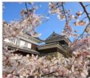
สวนซากปราสาทอุเอเดะ