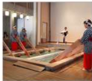
ชมกวนน้ำแร่ยุโมมิ