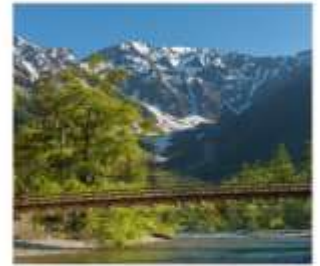
ดามิโดจิ