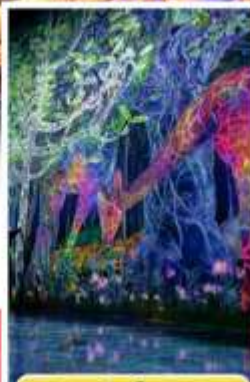
ทีมแล็บโตเกียว