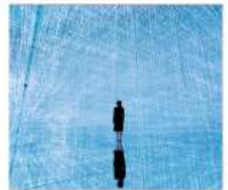
ทีมแล็บแพคนเน็ตโตเกียว