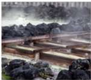
ชมยูนาทาเกะ