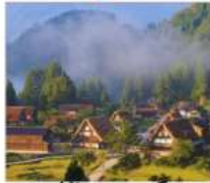
หมู่บ้านมรดกโลก โกะดะยะมะ