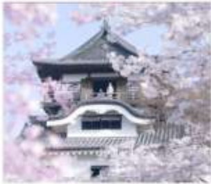
ปราสาทอินยาม่า