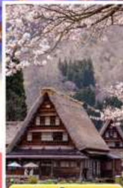
หมู่บ้านโทะคะยะมะ