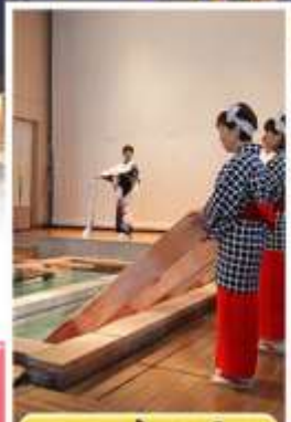
ชมกวนน้ำแร่ยูโมมิ