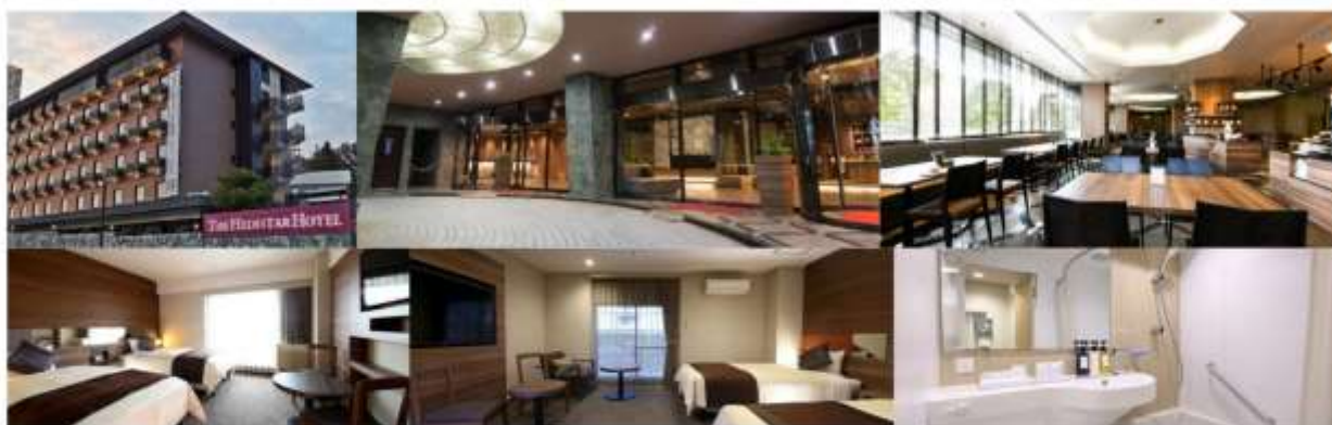
รูปภาพใช้เพื่อประกอบการโฆษณาเท่านั้น