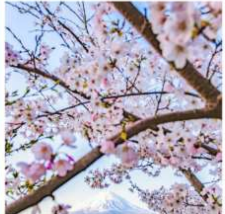
KOGAMASAO MEMORIAL PARK