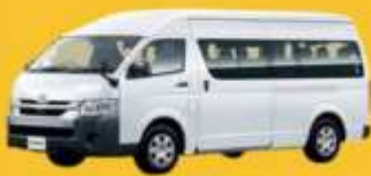
VAN (2-8 ท่าน)