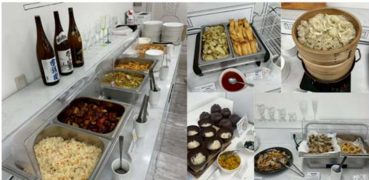
รูปภาพใช้เพื่อประกอบการโฆษณาเท่านั้น