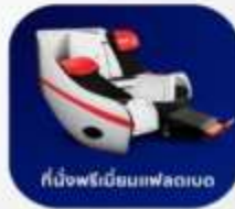
ที่นั่งพรีเมียมเฟลตทอป