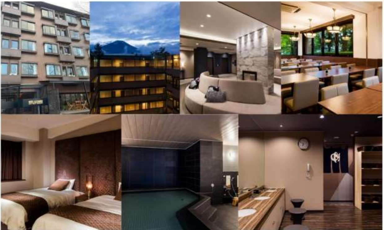
รูปภาพใช้เพื่อประกอบการโฆษณาเท่านั้น

ให้ทำบดได้ผ่อนคลายกับการแช่น้ำแร่ร้อนเชิงธรรมชาติ เชื่อว่าถ้าได้แช่น้ำแร่แล้ว จะทำให้ผิวพรรณสวยงาม และช่วยให้ระบบหมุนเวียนโลหิตดีขึ้น