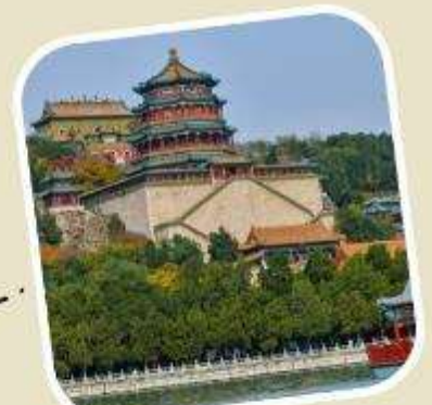
4 พระราชวังฤดูร้อน