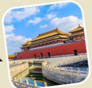
3 พระราชวังต้องห้าม