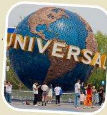
5 UNIVERSAL BEIJING