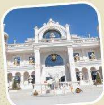
6 POP LAND