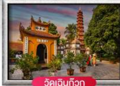
วัดเงินทิว๊ก