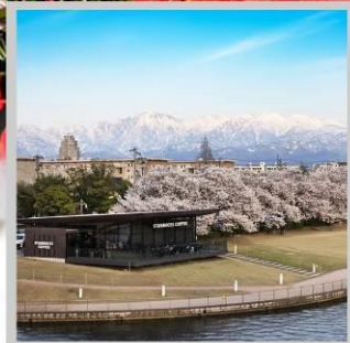
“TOYAMA KANSUI PARK”