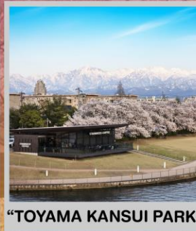
"TOYAMA KANSUI PARK"