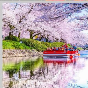
“MATSUKAWA RIVER BOAT”