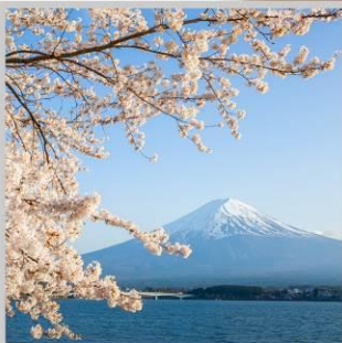
“LAKE KAWAGUCHIKO SAKURA”