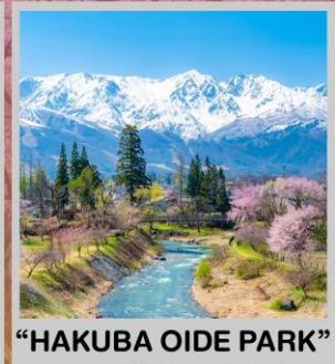
"HAKUBA OIDE PARK"