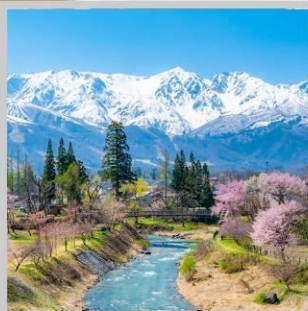
“HAKUBA OIDE PARK”