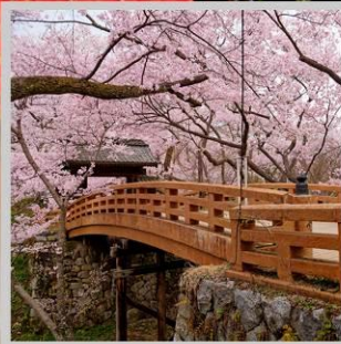
“TAKATO CASTLE RUINS”