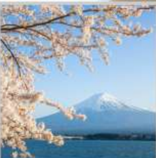
"LAKE KAWAGUCHIKO SAKURA"