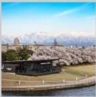
"TOYAMA KANSUI PARK"