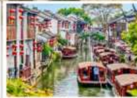
ย่านเมืองโบราณซานตง