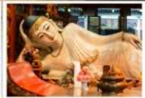
วัดพระหยก

✓ พรีเมียมทัวร์ ✓ ไม่เข้าร้านรัฐบาล ✓ ทัวร์กรุ๊ปเล็ก ✓ ที่พักระดับ 5 ดาว ✓ รวมค่าเข้าชมตามที่ตามโปรแกรม