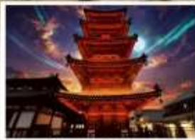
หมู่บ้านเหนียนฮั่ววาน