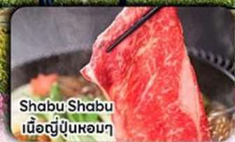
Shabu Shabu เนื้อญี่ปุ่นหอมๆ