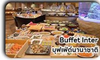
Buffet Inter บุฟเฟต์นานาชาติ