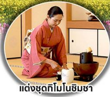
แต่งชุดกิโมโนชิมซา