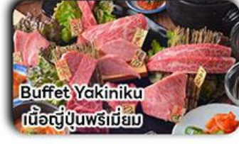
Buffet Yakiniku เนื้อญี่ปุ่นพรีเมียม