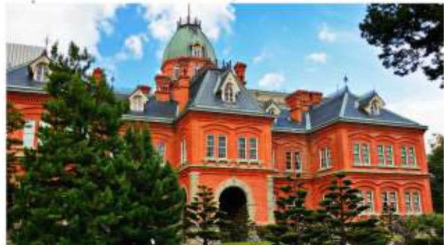
FORMER HOKKAIDO GOVERNMENT OFFICE