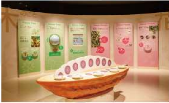
ROYCE CACAO & CHOCOLATE TOWN