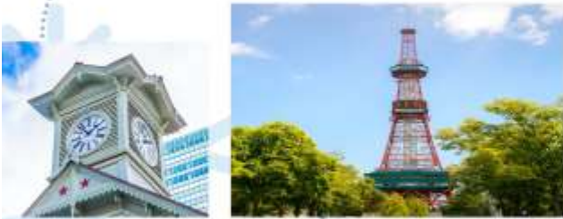
SAPPORO TV TOWER // CLOCK TOWER (VIA)

ผ่านชม บรรยากาศงดงามของ “สวนโอโคโนะ” ใจกลางเมือง // แลนด์มาร์กชื่อดังอย่าง “ซัปโปโรทีวีทาวเวอร์” // “หอนาฬิกาซัปโปโร” สัญลักษณ์แห่งประวัติศาสตร์ญี่ปุ่น