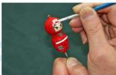
KOKESHI DOLL PAINTING