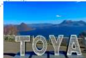
SILO OBSERVATION DECK