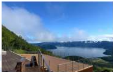
USUZAN ROPEWAY & BEAR FARM