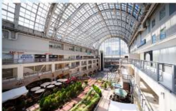
SHOPPING AT SAPPORO FACTORY