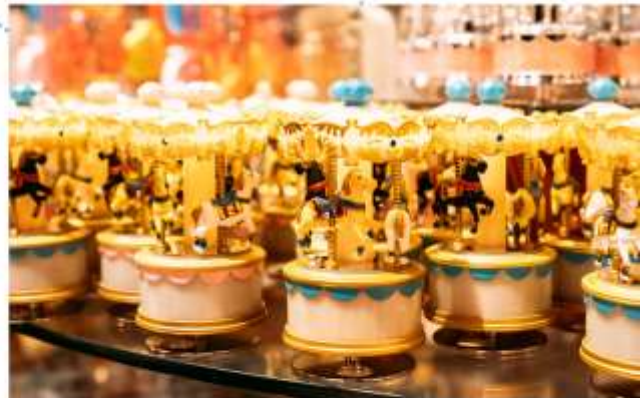
รับประทานอาหารกลางวัน ณ กิตดาการ