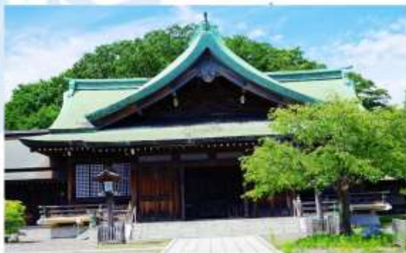
MURORAN HACHIMANGU SHRINE

มุ่งหน้าสู่ "ทะเลสาบโทยะ" ทะเลสาบปล่องภูเขาไฟขนาดใหญ่ที่สวยงามราวกับภาพวาด โอบล้อมด้วยขุนเขาและธรรมชาติ