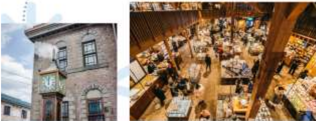
MUSIC BOX MUSEUM & STEAMED CLOCK TOWER

แวะชม “หอนาฬิกาไอน้ำโบราณ” ของขวัญจากเมืองเวเนซุเอลา มาพิคา เรือนนี้จะส่งเสียงเพลงพร้อมพ่นไอน้ำออกมามาก ๆ 15 นาที สร้างความตื่นตาตื่นใจและเป็นอีกหนึ่งจุดถ่ายรูปยอดนิยมที่ไม่ควรพลาด