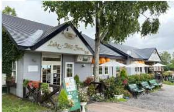
LAKE HILL FARM