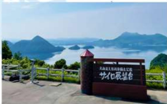
SILO OBSERVATION DECK

แวะเก็บภาพความประทับใจ ณ "จุดชมวิวยุไซ" ซึ่งได้รับการยกย่องว่าเป็นหนึ่งในจุดชมวิวที่สวยงามแห่งหนึ่งของฮอกไกโด คุณจะได้สัมผัสกับทัศนียภาพอันกว้างใหญ่ของทะเลสาบไทยะและเกาะนาคาซุมะ พร้อมฉากหลังเป็นภูเขาไทยะอันสง่างาม สวยงามราวภาพวาดที่คุณต้องไม่พลาด