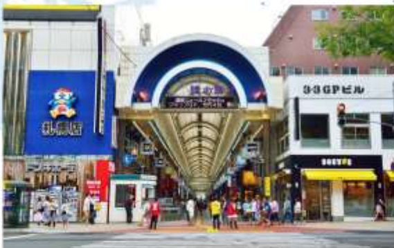
SHOPPING AT TANUKIKOJI