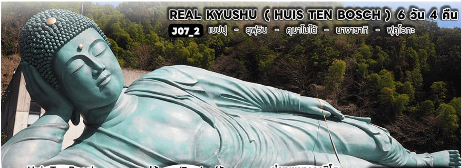
Huis Ten Bosch

J07_2 แปปุ - ฮูฟุอิน - คุมะโมโตะ - นางาซากิ - ฟุคุโอกะ