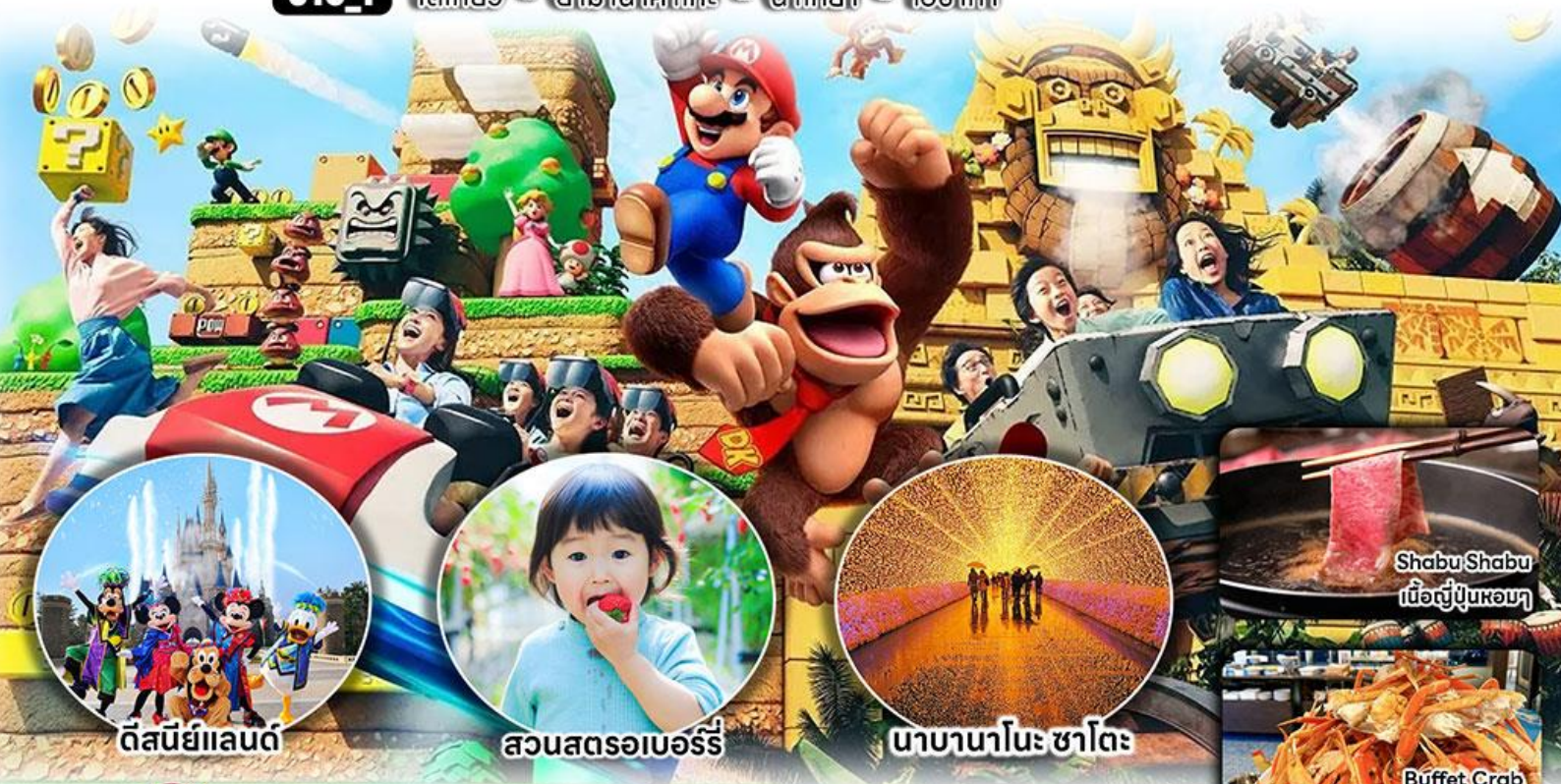
ดีสนีย์แลนด์

J10_1 โตเกียว - ยามาฮาโกะ - นาโงย่า - โอซาก้า