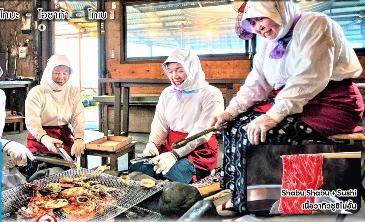
Shabu Shabu + Sushi เนื้อวากิวซูชิไม่อื่น