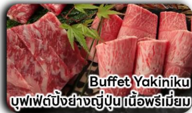
Buffet Yakiniku บุฟเฟ่ต์ปิ้งย่างญี่ปุ่นเนื้อพรีเมียม