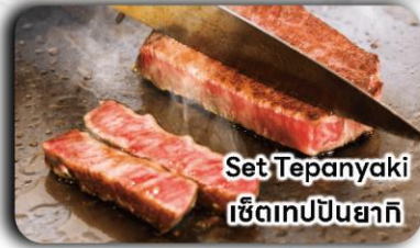
Set Tepanyaki เซตเทปียนยากิ