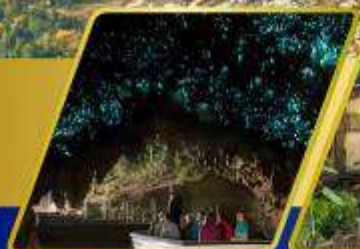
ถ้ำหอนเรื่องแสง