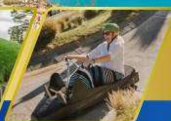
เล่นลู่ที่ควีนส์ทาวน์

✈ บินภายใน (เที่ยวสุดคุ้ม) พักโรงแรม 4 ดาว ★★★★★