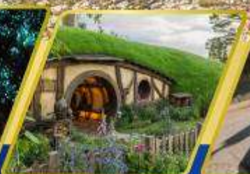
หมู่บ้านฮอบบิต