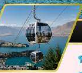
นั่งกระเช้าคอนโดล่า