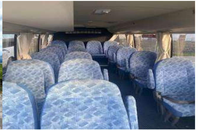
* ลुकค้าจำนวน 10 - 14 ท่าน ใช้รถบัสขนาด 19 - 21 ที่นั่ง*