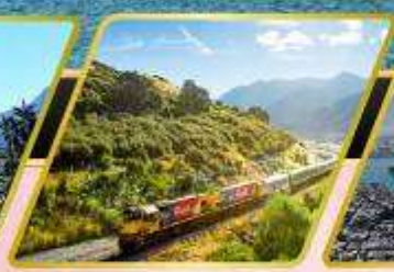
นั่งรถไฟทรานซ์ อัลไพน์