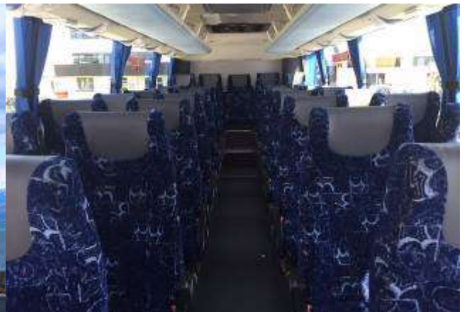
* ลุกค้าจำนวน 15 ท่านขึ้นไป ใช้รถบัสขนาด 30 - 35 ที่นั่ง*