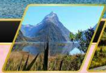
มิลฟอร์ด ซาวน์