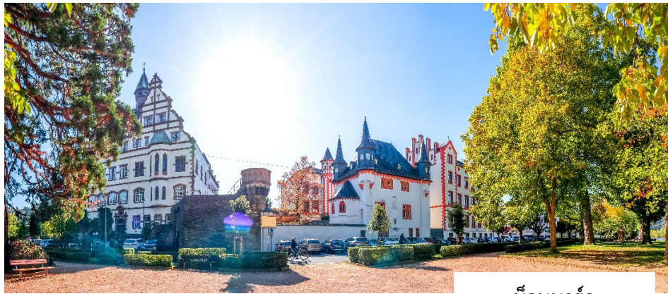
บ็อบบาร์ด (Boppard)

จากนั้นทุกท่านสามารถเดินชมได้ตาม อัครยาตย์ ชมบรรยากาศของเขตเมืองเก่าโคโลญจน์ ที่เต็มไปด้วยเสน่ห์ของอาคารเก่าแก่และถนนสายประวัติศาสตร์ พร้อมเลือกซื้อสินค้าพื้นเมือง ของที่ระลึกขึ้นชื่อ อาทิ น้ำหอมโคโลญจน์ 4711 อันเป็นต้นกำเนิดของน้ำหอมประเภท "โคโลญจน์" รวมถึงสินค้าแบรนด์เนมชื่อดัง นานาชนิดที่เรียงรายอยู่ตลอดแนวถนนคนเดิน (Walking Street) รอบบริเวณมหาวิหาร นำท่านเดินทางสู่ เมืองบ็อบบาร์ด (Boppard) เมืองเล็กๆ อันเงียบสงบที่ตั้งอยู่ริมฝั่งแม่น้ำไรน์ตอนกลางของประเทศเยอรมนี เมืองแห่งนี้เปี่ยมด้วยเสน่ห์ของสถาปัตยกรรมเก่าแก่และยังเป็นบ้านเรือนสีสันสดใสที่ได้รับการอนุรักษ์ไว้อย่างดี ประกอบกับทัศนียภาพอันงดงามของแม่น้ำไรน์และธรรมชาติโดยรอบ