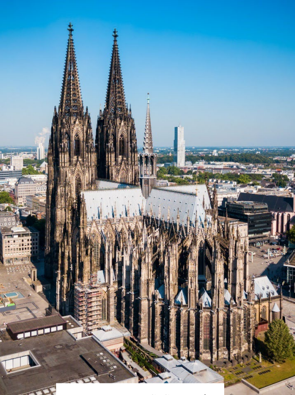
มหาวิหารแห่งโคโลญจน์ (Cologne Cathedral)

จากนั้นทุกท่านสามารถเดินชมได้ตาม อัครยาตย์ ชมบรรยากาศของเขตเมืองเก่าโคโลญจน์ ที่เต็มไปด้วยเสน่ห์ของอาคารเก่าแก่และถนนสายประวัติศาสตร์ พร้อมเลือกซื้อสินค้าพื้นเมือง ของที่ระลึกขึ้นชื่อ อาทิ น้ำหอมโคโลญจน์ 4711 อันเป็นต้นกำเนิดของน้ำหอมประเภท "โคโลญจน์" รวมถึงสินค้าแบรนด์เนมชื่อดัง นานาชนิดที่เรียงรายอยู่ตลอดแนวถนนคนเดิน (Walking Street) รอบบริเวณมหาวิหาร นำท่านเดินทางสู่ เมืองบ็อบบาร์ด (Boppard) เมืองเล็กๆ อันเงียบสงบที่ตั้งอยู่ริมฝั่งแม่น้ำไรน์ตอนกลางของประเทศเยอรมนี เมืองแห่งนี้เปี่ยมด้วยเสน่ห์ของสถาปัตยกรรมเก่าแก่และยังเป็นบ้านเรือนสีสันสดใสที่ได้รับการอนุรักษ์ไว้อย่างดี ประกอบกับทัศนียภาพอันงดงามของแม่น้ำไรน์และธรรมชาติโดยรอบ