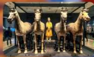
สุสานทหารจิ้นซี