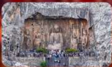
ถ้ำผาหลงเหมิน