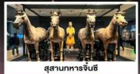
สุสานทหารจีนซี