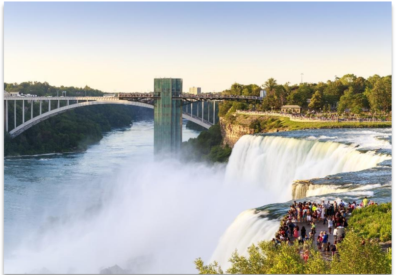
NIAGARA FALLS OBSERVATION AREA

เกิดจากกระแสน้ำมหาศาลที่ไหลมาจาก ทะเลสาบทั้งห้า (Great Lakes) ก่อนจะไหลลงสู่แม่น้ำไนแอกการ่า ซึ่งกั้นพรมแดนระหว่างประเทศ สหรัฐอเมริกา และแคนาดา สร้างภาพความงดงามและยิ่งใหญ่ของธรรมชาติที่ไม่มีที่ใดเหมือน นำท่านเดินเข้าสู่ “จุดชมวิวน้ำตกไนแอกการ่า” (Niagara Falls Observation Area) เพื่อชื่นชมทัศนียภาพของน้ำตกที่โอบล้อมด้วยหมอกละอองน้ำและสายรุ้งหลากสี พร้อมเก็บภาพความประทับใจอันงดงามได้อย่างเต็มที่