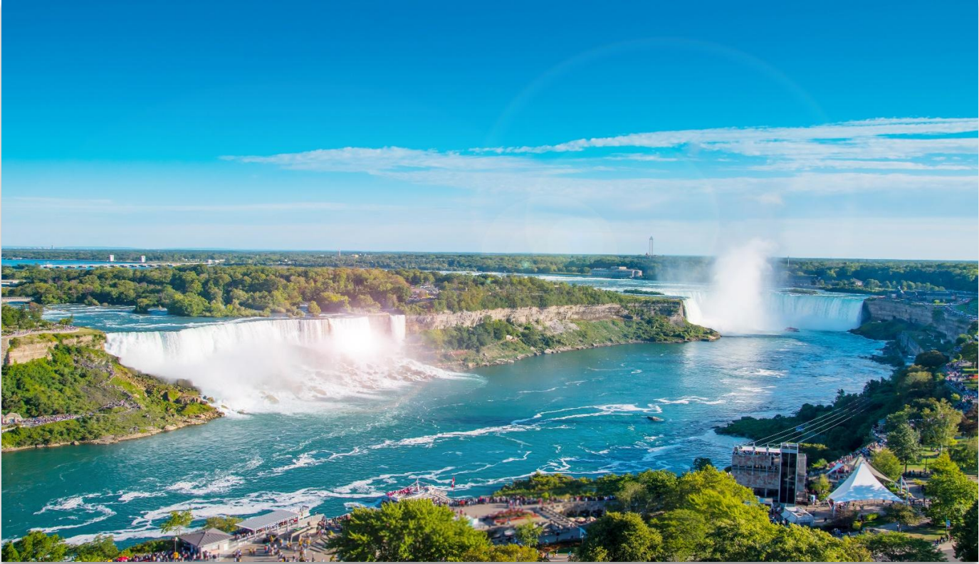
NIAGARA FALLS STATE PARK

นำท่านเดินทางสู่ “อุทยานแห่งชาติไนแอกการ่า” (Niagara Falls State Park) ฝั่งสหรัฐอเมริกา หนึ่งในสิ่งมหัศจรรย์ทางธรรมชาติของโลก ที่ได้รับการยกย่องให้เป็นสถานที่ท่องเที่ยวยอดนิยม และเป็น หนึ่งในสามจุดหมายปลายทางสุดโรแมนติกสำหรับการดื่มด่ำน้ำfallsพระจันทร์ของคู่บ่าวสาวชาวอเมริกัน น้ำตกไนแอกการ่า