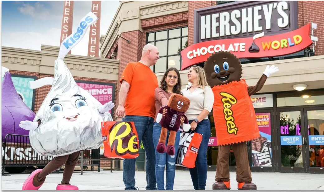
ค้ำ บริการอาหารค้ำ ณ ภัตตาคาร

เข้าชมได้เนื่องจากเดินทางมาถึงล่าช้า บริษัทขอสงวนสิทธิ์ในการไม่คืนเงินหรือชดเชยใด ๆ ในทุกกรณี) ด้วย เครื่องจักรเก่าแก่และเทคนิคการผลิตช็อกโกแลตดั้งเดิมของ HERSHEY'S โรงงานก่อตั้งขึ้น ในปี ค.ศ. 1876 ในโรงงานแห่งนี้ยังมีผลิตภัณฑ์ยอดนิยมอย่าง Hershey's Crystal A ลูกอมคาราเมลรสนม ที่โด่งดังด้วยสโลแกน "Melt in Your Mouth" นำท่านออกเดินทางสู่ "กรุงวอชิงตัน ดี.ซี."