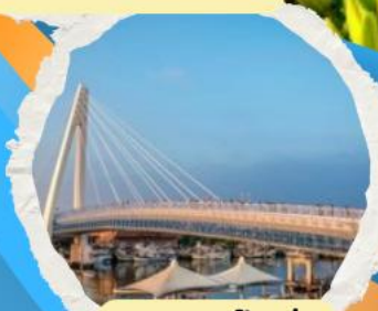
สะพานต้งสู่ย