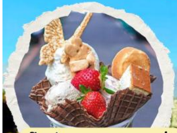
ร้าน ไอศกรีมมิยาฮาระ