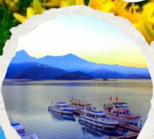
ทะเลสาบสุริยขึ้นจินทารา