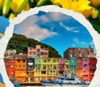
ท่าเรือเจิ้งปิง