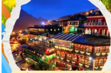
หมู่บ้านโบราณฉิวเฟิ่ง