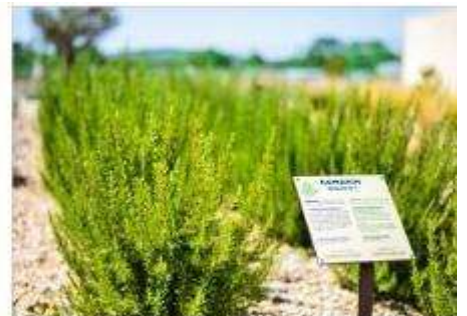
The Mediterranean Garden