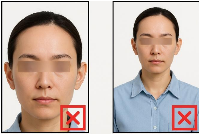
รูปที่ไม่ได้ขนาด ตามที่สถานทูตกำหนด