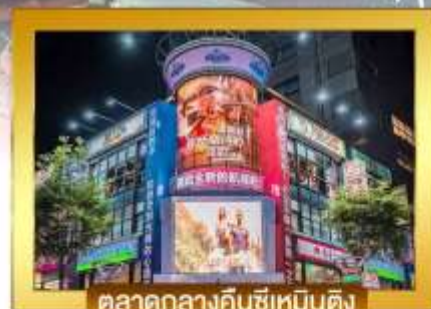
ตลาดกลางคินซีเหมินติง